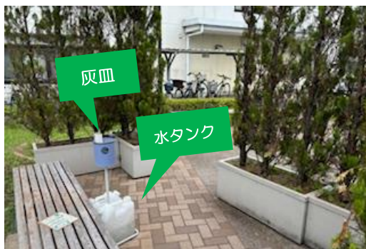
【屋外にある[喫煙コーナー] 利用者が管理

②喫煙率の改善は、2019年23.1%→2022年20.0%と際立って効果が出ているとは言えない状況のため、今後に向けて施策を検討中ではありますが、喫煙可能時間や灰皿・吸い殻の自己管理など喫煙ルールを策定して、喫煙するのを 面倒臭くしている のが抑止力になっているのかもしれませんが。」