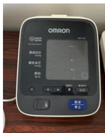
本社に5台設置 【血圧計】