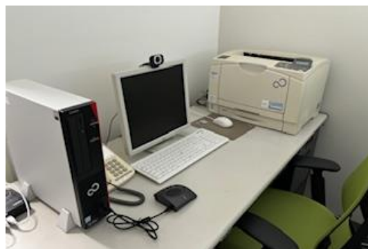
産業医の先生の【健康講話発信基地】

「毎年の(健康優良法人の)認定取得、偏差値アップに難しさを感じています。また、産業医の先生の健康講話などで社員の興味関心を深め、健康リテラシーを向上させたいのですが、健康経営の効果が健康診断結果に表れにくい。特に健康診断後の二次検診や特定保健指導の受診率が低い(2023年度特定保健指導初回面談参加率 27.0%、二次検診受診率22.6%)です。これは結構な問題です、今後の大きな課題ですね。」