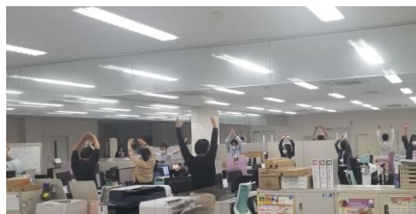
毎日15時に実施の「ラジコ体操」

「健康優良法人を取得することで会社イメージをアップさせて社員採用に有利につなげたい。一方で健康診断の結果やストレスチェックの集計することで、積極的にデータ解析して社員の健康状況を把握し、改善しようと思ったのがきっかけです。」