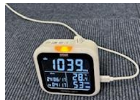
全社に26台設置 【酸素濃度計】