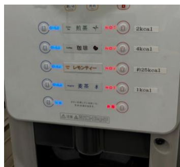
【カロリーの表示が…] 冷蔵庫と給茶機にも注意喚起!!

特にウォーキングイベントは毎年盛り上がりを見せており、今開催を楽しみにしている社員がおります。今後も社員の健康状態改善に向けて尽力していきますので、何卒よろしくお願い申し上げます。」