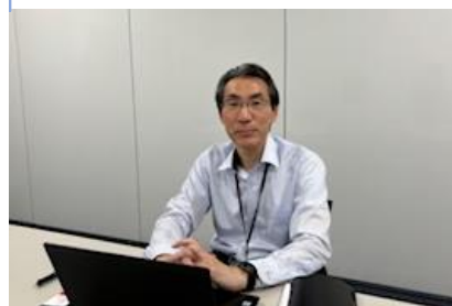
お話を伺った 狩野人事部長