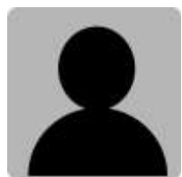
A 工場の B さん

(質問 1) 健診機関で引き続き、保健指導を実施いただいておりますが、対象者の選定はどのようにされていますか？